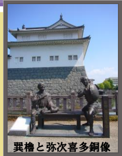
異櫓と弥次喜多銅像