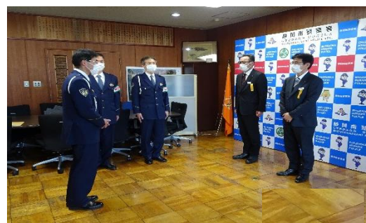
飲酒運転根絶・安全運転宣言書提出