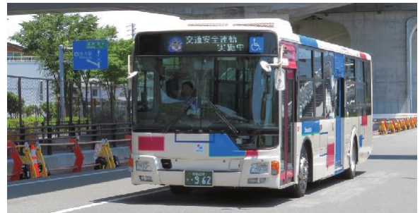
交通安全県民運動

また、近年では、静岡県警察様と共同でバスの行先表示機（方向幕）を活用した交通安全運動を全国に先駆けて行っております。