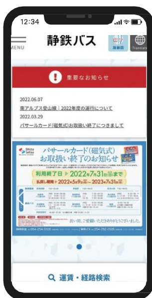
静鉄バスホームページ